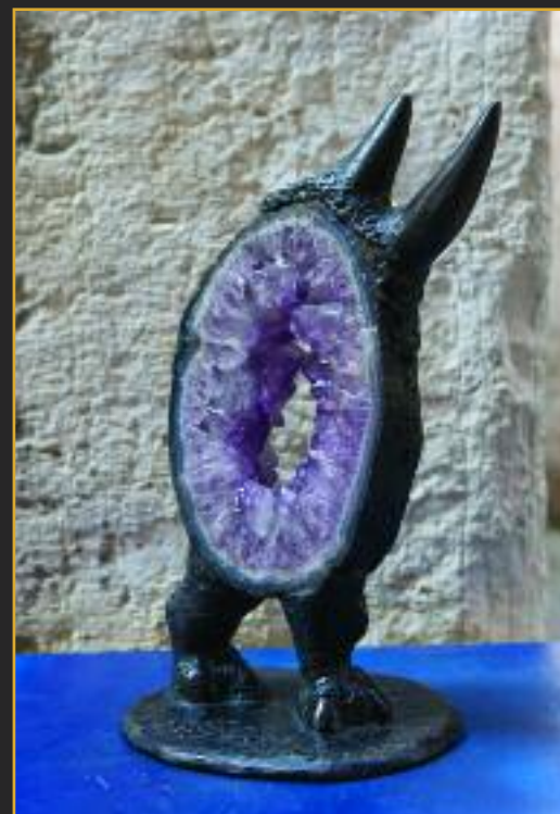
Agatha, bronzo, cera persa ed agata

Studio: San Marco, 3084 - 30124 Venezia Telefono: 041 5239570 Sito web: www.gigibonvenezia.com E-mail: gigibonvenezia@virgilio.it Quotazioni opere: da euro 500,00 a 70.000,00.