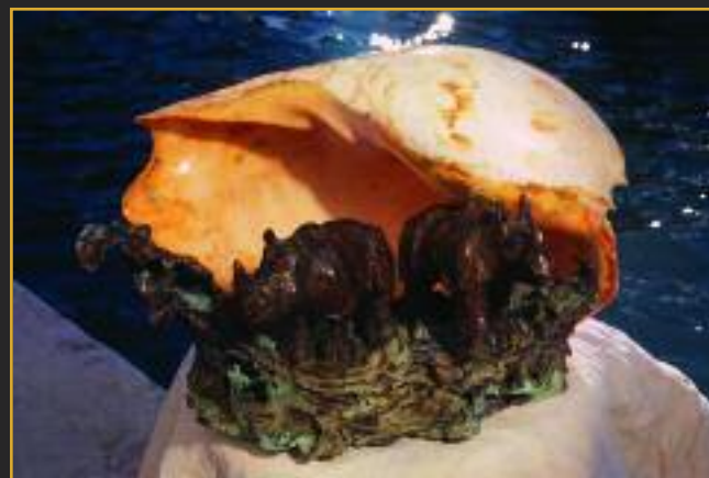
Presepe Rhino, bronzo, cera persa e conchiglia naturale