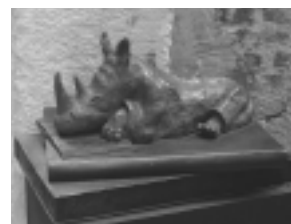
[00-00] Babyrhino sapiente, 1992. A destra, TITOLO CAVALLO + ANNO

Nei brevi o lunghi attimi del nostro curiosare, incontreremo un mondo popolato da esseri fantastici e reali insieme; animato da fantasie e sogni che fanno parte integrante della vita e che ne scandiscono il tempo. Un percorso fatto di immagini sognate e trasferite su carta, tela o materializzate in bronzi lucidi e patinati, usciti dal fuoco delle fonderie, come animali preistorici o mitologici plasmati dalle mani di Vulcano. Chi direbbe che questa raffinata ed elegante ragazza passa parte del suo tempo a modellare sogni, utilizzando l'antica arte della cera persa per realizzare pesanti sculture, tutti pezzi unici? Pezzi unici perché, come indica il termine "tecnica della cera persa", il modello in cera, che nasce da una prima scultura modellata in creta, dà vita a una sola ed esclusiva opera, prima di sciogliersi e sparire. La nostra artista, per creare, si divide tra la fonderia e il suo studio veneziano che assomiglia all'antrò di Cagliostro, animato da mille personaggi inverosimili. Una folla di "anime" che sembrano uscite dai libri rari che fanno bella mostra di sé abbandonati aperti, come se una mano invisibile ne voltasse le pagine sotto il nostro naso di visitatori a volte troppo frettolosi e insensibili.